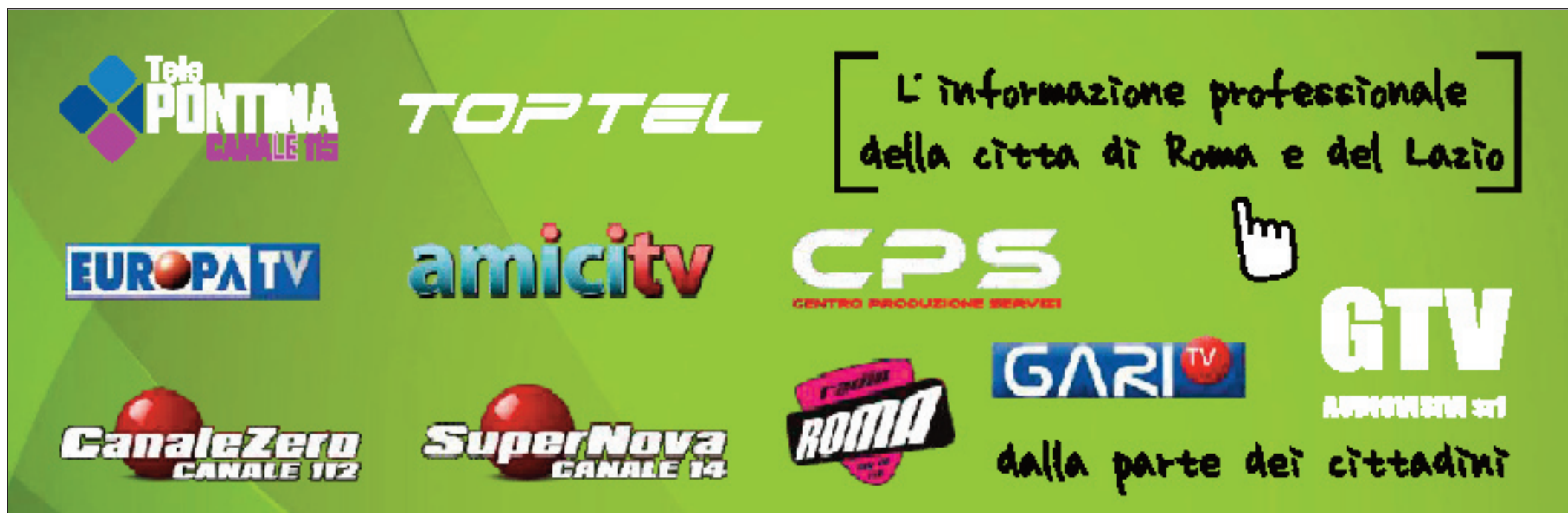
a pagina 3