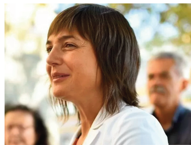
a pagina 3

SERRACCHIANI: "UNA PROPOSTA CHE TROVA IL CONSENSO DI ZAIA VA PRESA SERIAMENTE"